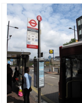
ป้ายในภาพนี้คือ E

ประเด็นสำคัญที่สุดของการขึ้นบัตร คือ รถบัสนั้นไม่จอดที่ป้ายทุกป้ายของรถสายนั้น ดังนั้น เราต้องรู้จักประเภทของป้ายหยุดรถ ซึ่งมี 2 ประเภท คือ Bus Stop และ Request Stop ความแตกต่างคือ ประเภทแรกจะต้องจอดป้ายเสมอ ประเภทที่สอง รถจะจอดต่อเมื่อเราโบกรถ แต่ทั้งนี้ การลงรถสามารถทำได้ทุกป้ายของรถบัสนั้นๆ โดยการกดกริ่งบนรถบัสนั้น การหาป้ายหยุดรถที่ต้องการทำได้โดยดูจากแผนที่ ที่จะมีติดอยู่ตามป้ายรถทั่วไป โดยดูปลายทางที่ต้องการ หาเบอร์ป้าย และดูชื่อป้าย จากนั้นก็ดูแผนที่ว่าป้ายชื่อดังกล่าวอยู่ตรงไหน